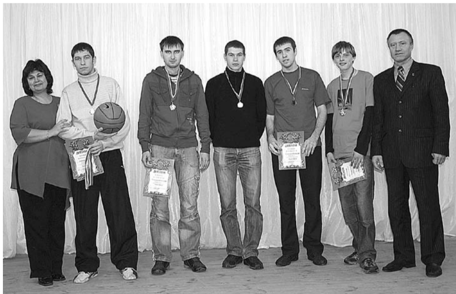
Команда по баскетболу, 1 место