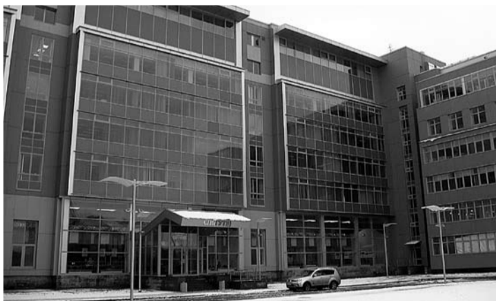
Место проведения конференции - СПб ГУТ