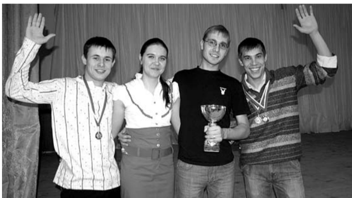
Победители в общекомандном зачете, золотой кубок

Наряду с продолжающейся в СамГТУ внутриуниверситетской спартакиадой в студенческом городке прошла своя очередная спартакиада среди юношей. Соревнования проводились по таким видам спорта, как волейбол, футбол, баскетбол, гиревой спорт, жим штанги, дзюдо и каратэ. Многие ребята достигли высоких результатов, причем в нескольких спортивных дисциплинах. Жаль, что в спартакиаде приняла участие только мужская половина студгородка. В общекомандном зачете победили ребята общежития №7, они и были удостоены золотого кубка.